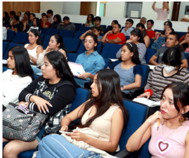
Numerosa asistencia de jóvenes estudiantes universitarias en esta actividad.