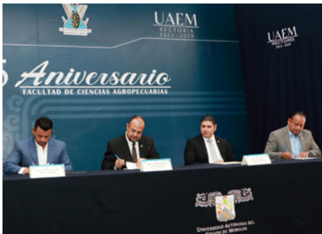
En la ceremonia de aniversario se signaron convenios de vinculación académica.