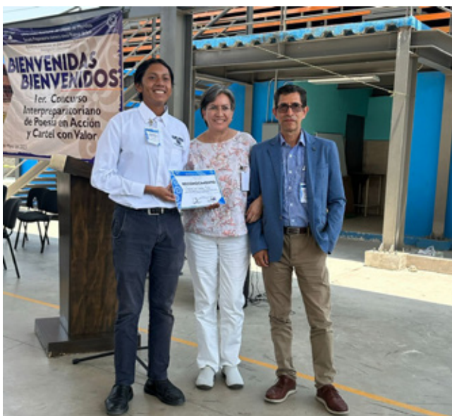
Premiación a ganadores del primer Concurso Interpreparatoriano Cartel con Valor-Poesía en Acción.