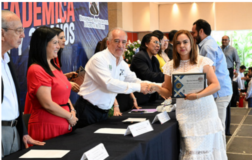
El Sitauaem en compañía de la administración central, entregó reconocimientos a docentes con 5 y hasta 35 años de servicio.